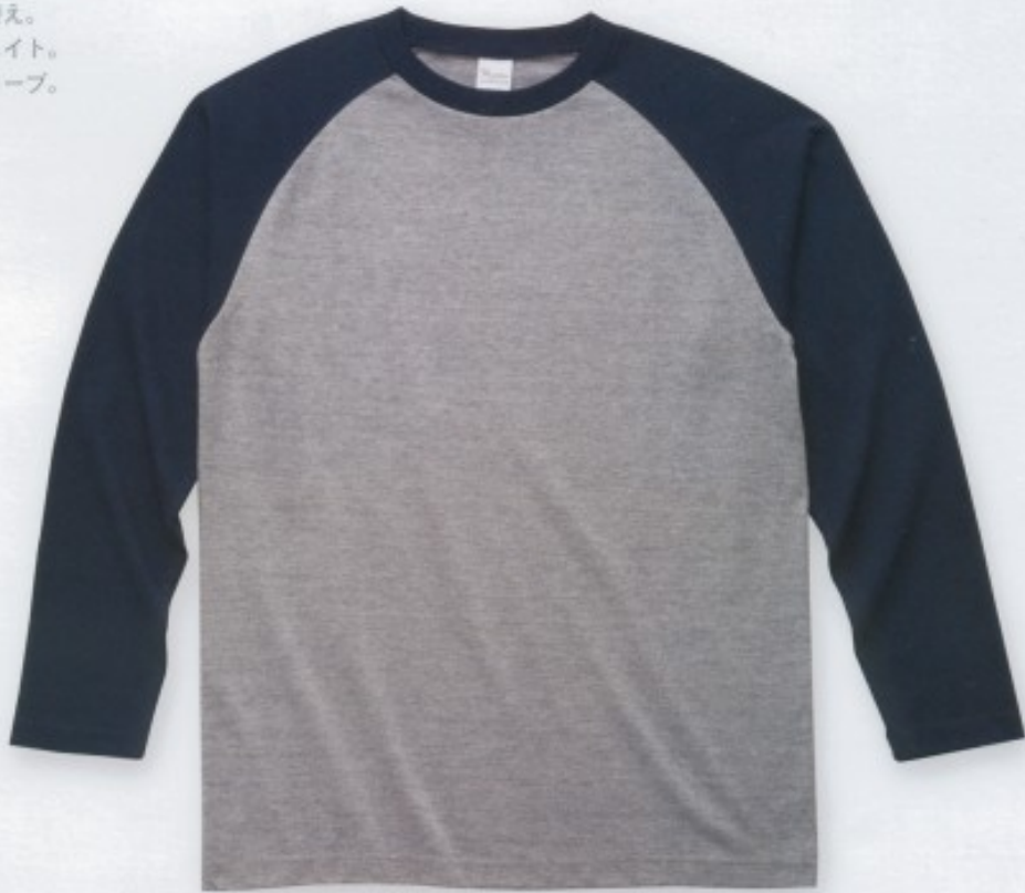
831 空グレー×ネイビー