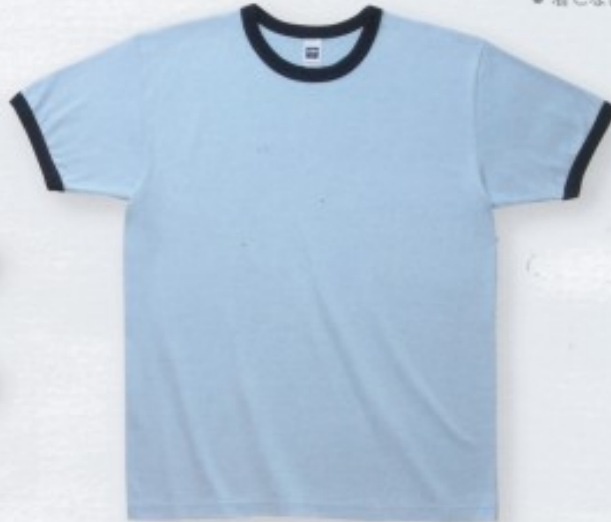
631 ライトブルー×ネイビー