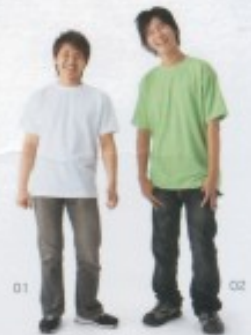
01 : 身長 / 167cm サイズ / M カラー / 001 (ホワイト) 02 : 身長 / 180cm サイズ / LL カラー / 155 (ライム)