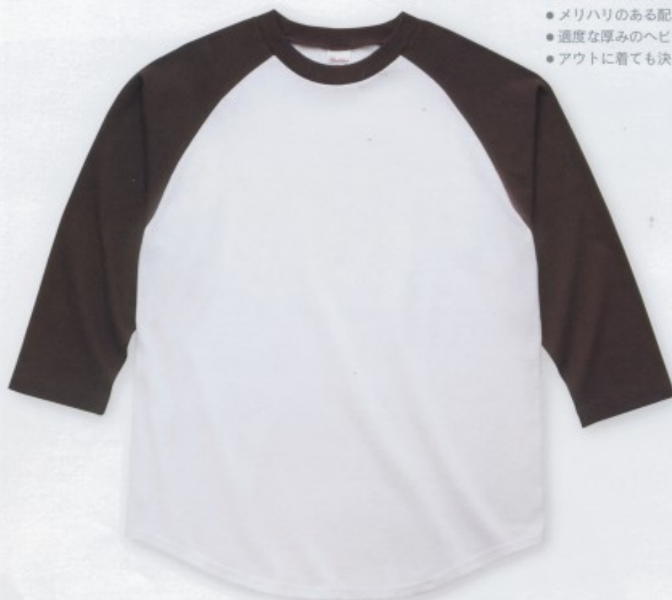
768 ホワイト×チョコレート