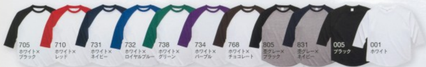
705 ホワイト× ブラック