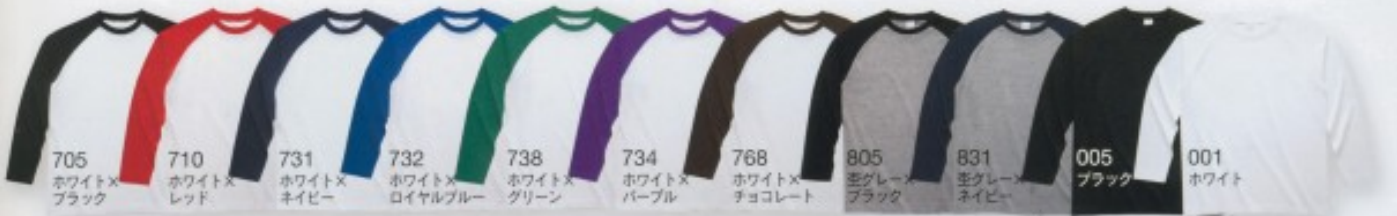
705 ホワイト×ブラック 710 ホワイト×レッド 731 ホワイト×ネイビー 732 ホワイト×ロイヤルブルー 738 ホワイト×グリーン 734 ホワイト×パープル 768 ホワイト×チョコレート 805 空グレー×ブラック 831 空グレー×ネイビー 005 ブラック 001 ホワイト

01: 身長/153cm サイズ/S カラー/710(ホワイト×レッド) 02: 身長/175cm サイズ/L カラー/805(空グレー×ブラック)