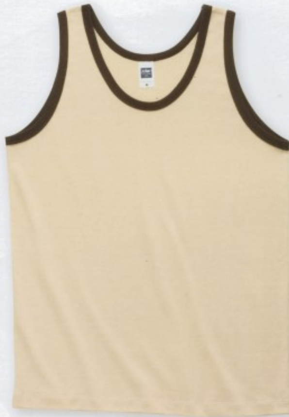
968 ナチュラル×チョコレート