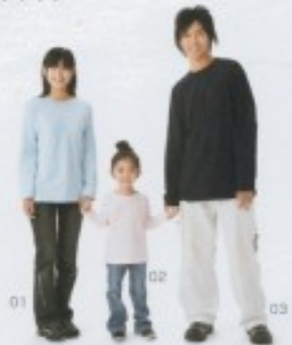
01 : 身長/156cm サイズ/160 カラー/133(ライトブルー) 02 : 身長/99cm サイズ/110 カラー/132(ライトピンク) 03 : 身長/180cm サイズ/XL カラー/031(ネイビー)