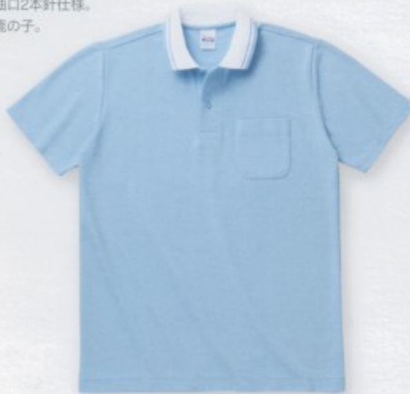
301 サックスXホワイト