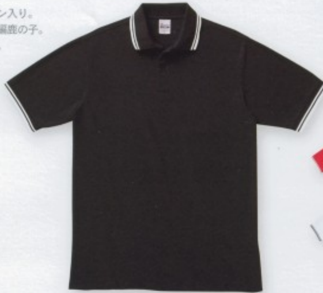
501 ブラック(Xホワイト)